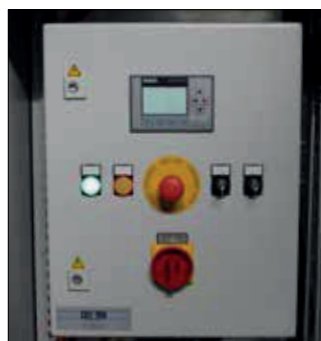
Contrôle avec arrêt d'urgence. Logo avec opération & Indication de défaut