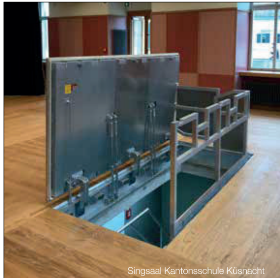
Singsaal Kantonsschule Küsnacht