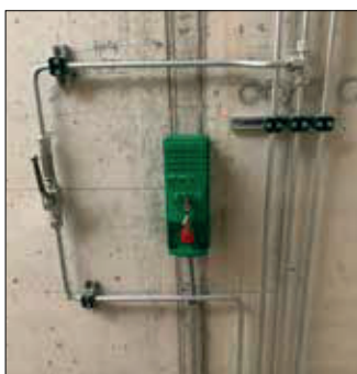
Interrupteur à clé et levier de secours