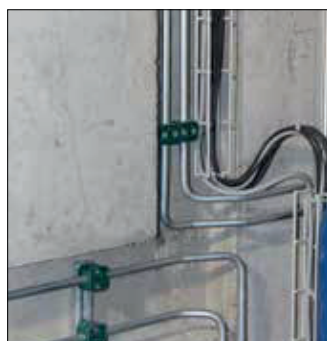
Tuyauterie électrique et hydraulique