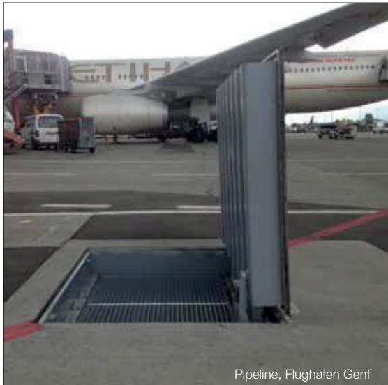
Pipeline, Flughafen Genf