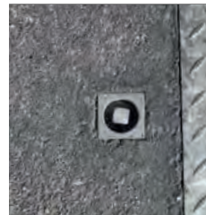
Schnellöffnung mittels Schraubvorreiber