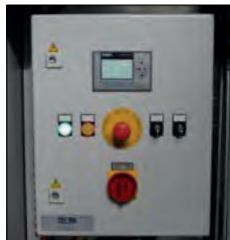
Steuerung mit Notaus. Logo mit Betriebs- & Störungsanzeige