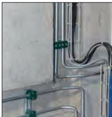
Elektro- und Hydraulikverrohrung