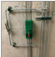
Schlüsselschalter & Nothebel